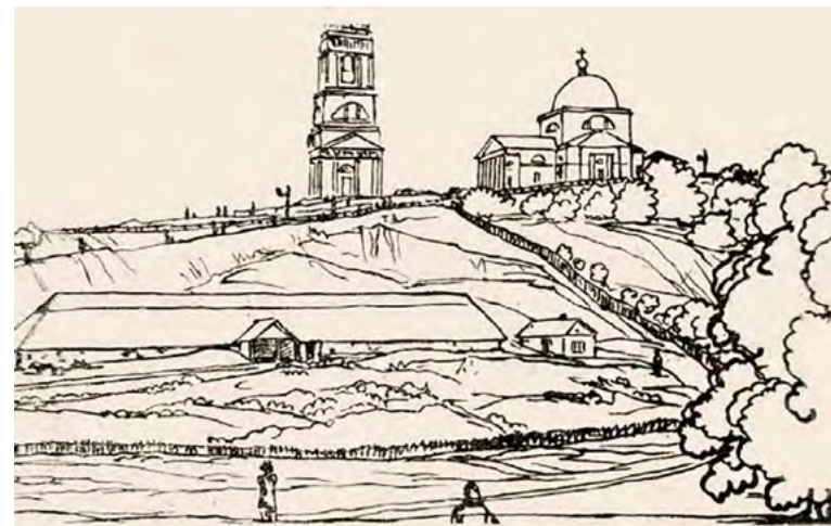
Рисунок В.А. Жуковского. Христорожественский собор. (1837 г.)

И по окончании семинарии отец Пётр продолжил самообразование. Он приобрёл множество книг духовного и светского содержания, знал все религиозно-философские течения того времени, имел большие познания в медицине. Выходец из бедных крестьян,