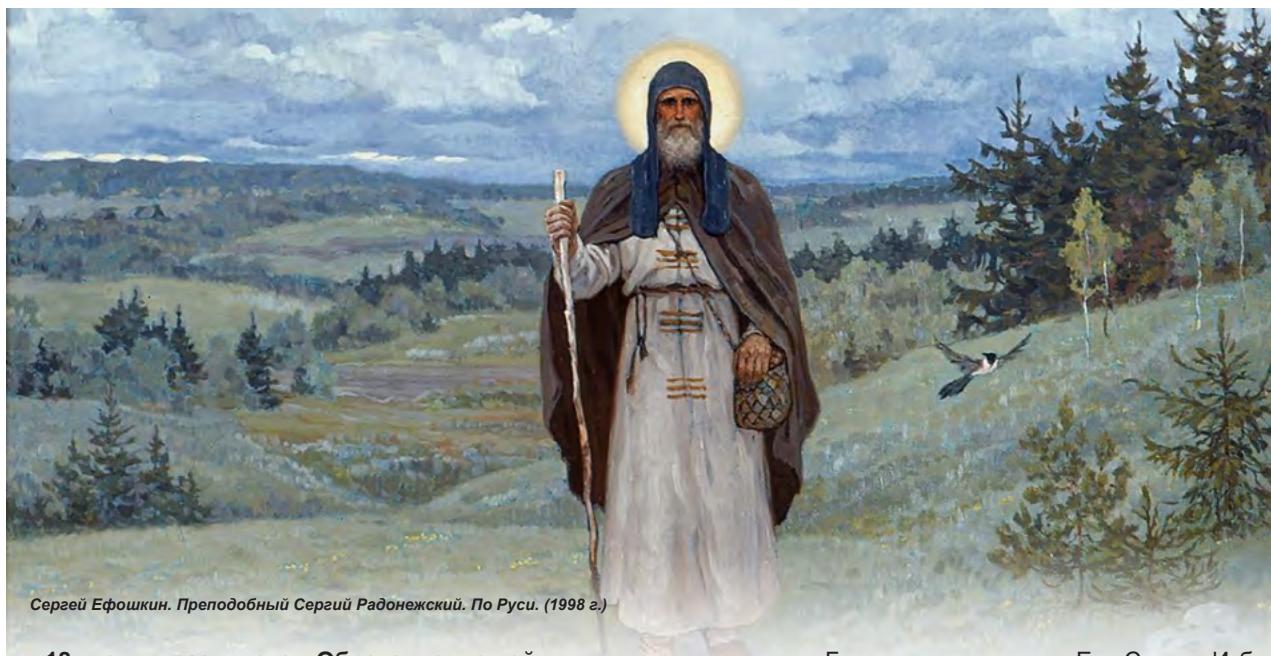
Сергей Ефимкин. Преподобный Сергий Радонежский. По Руси. (1998 г.)

18 июля празднуется Обретение мощей преподобного Сергия Радонежского, 8 октября – память его преставления.