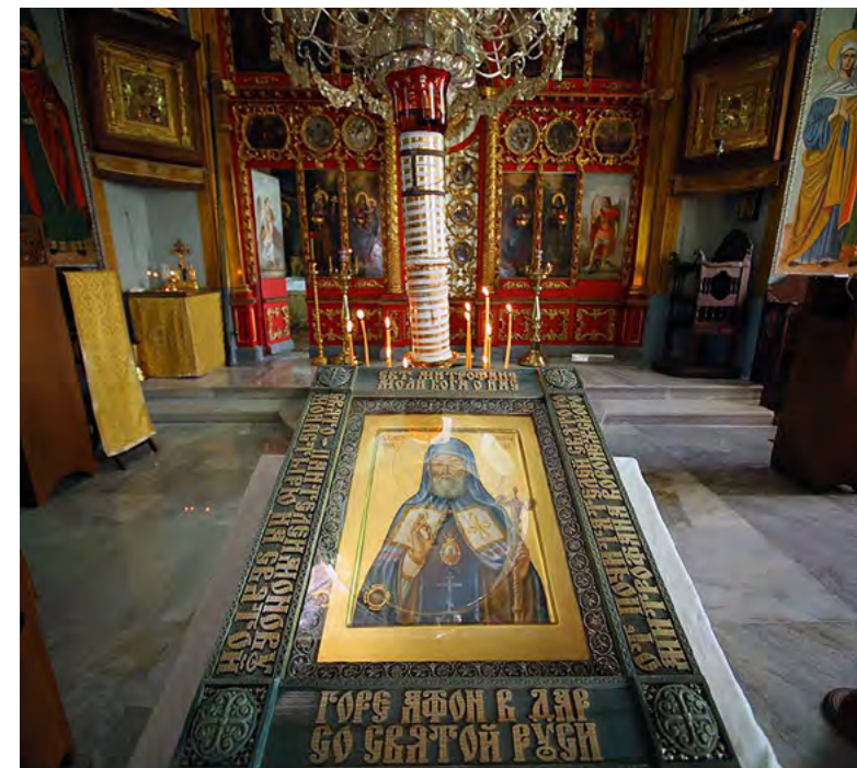
Икона свт. Митрофана с частицей мощей. Афон.