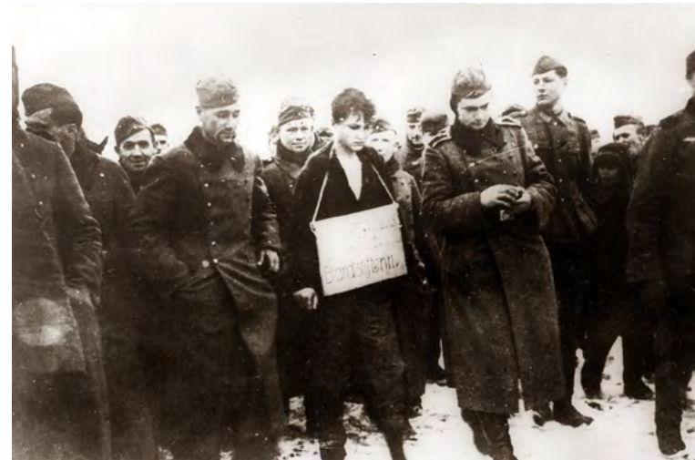
Немецкие солдаты ведут на казнь Зою Космодемьянскую. Трофейный снимок. (1941 г.)

Две православные даты. Далёкие эпохи, разные события, которые удивительным образом, по промыслу Божию, говорят о многом.