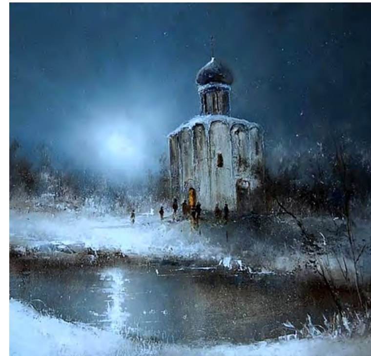
Игорь Медведев. Церковь на Нерли.