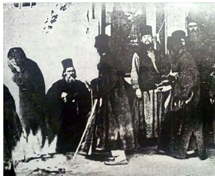
Чудо явления Божией Матери 21.08.1903. Фотография.