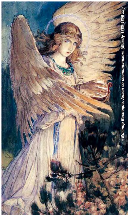
Виктор Васнецов. Ангел со свечильником. (Между 1895-1896 гг.)

Христианские образы в творчестве Виктора Васнецова