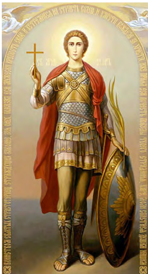
Святой мученик Уар.

Два события церковного календаря – 19 октября (1 ноября) и 1 (14 ноября) происходили во времена далёкие, но, перекликаясь в веках с событиями современными, по промыслу Божию они стали для ныне живущих очередным напоминанием о вечных христианских истинах.