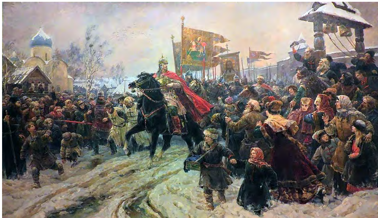
Валентин Серов. Въезд Александра Невского во Псков после Ледового побоища. (1945 г.)

Военно-стратегические действия Александра, а также предпринятые им шаги по укреплению духа воинов можно смело вносить в хрестоматийные примеры. Перво-наперво князь призвал православных христиан не бояться врага. Как только Александра известили о вторжении, он, по православному обычаю, собрал воинов у собора Святой Софии Новгородской. Архиепископ Спиридон, отправляя православных чад своих на смертный бой, благословил их. После горячей молитвы князя из уст Александра прозвучала