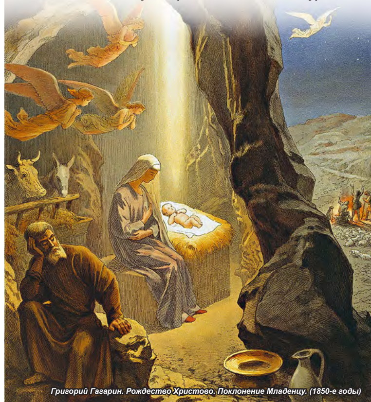
Григорий Гагарин. Рождество Христово. Поклонение Младенцу. (1850-е годы)