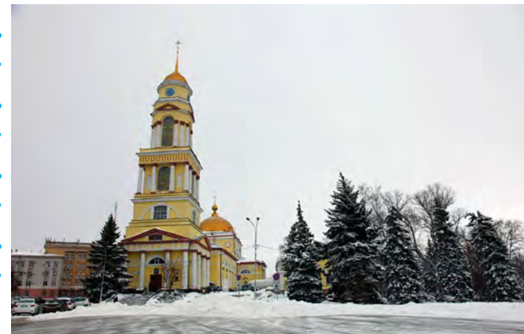
Кафедральный собор Рождества Христова в Липецке.

Вершину горы в Липецке, на которой расположен кафедральный собор, липчане издавна называют Соборной площадьюю.