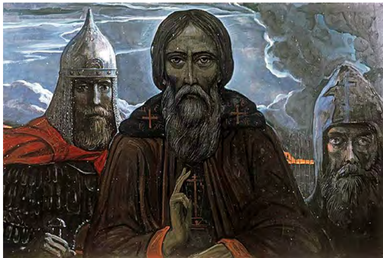
Илья Глазунов. Канун. Сергей Радонежский и Дмитрий Донской. (2004 г.)

Нам надо быть в постоянной связи со страдающей частью теперешней России, с Россией чудес, подвигов, мученичества. Связь эта возможна в создании здесь той же напряжённой религиозной жизни – продолжения здесь нашей родины. Это, может быть, выведет взрослых из их политических разделений, а молодых приблизит к Церкви и покажет им то, что было сутью России».